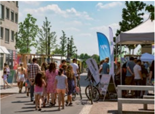
Stand von FRANKLIN Mobil beim SPINELLI Fest

Auf zum SPINELLI Mobilitätstag! Am Samstag, den 9. September, können Sie von 11 bis 17 Uhr entlang der Völklinger Straße das attraktive Angebot der verschiedenen Mobilitätsanbieter im Quartier kennenlernen. Neben dem Verkehrsunternehmen rnv, das über den ÖPNV in Mannheim und das On-Demand-Shuttle fips informiert, ist selbstverständlich auch die Mobilitätsmanagementgesellschaft FRANKLIN Mobil vertreten, die die ersten Sharing-Fahrzeuge im Quartier bereithält und ihr Angebot sukzessive ausbaut. Eine gute Gelegenheit also, ins „Sharing-Geschäft“ einzusteigen, um sich ein Fahrzeug genau dann zu leihen, wenn man es auch braucht.