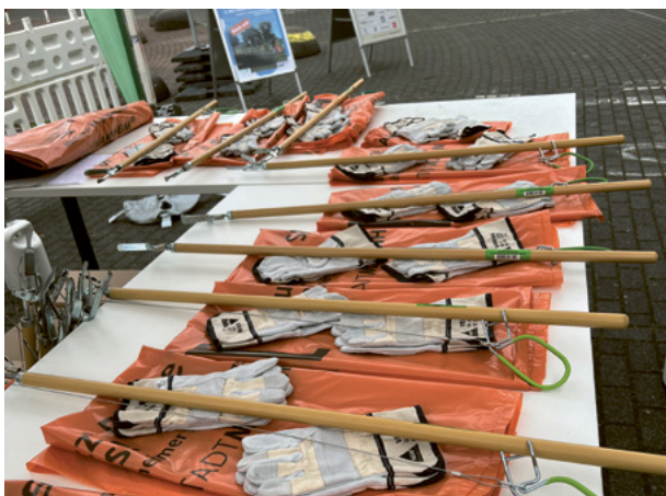
Wichtige Utensilien für Sauberkeitspat*innen

Wenn Sie sich regelmäßig für die Sauberkeit in ihrer direkten Nachbarschaft auf SPINELLI engagieren möchten, können Sie darüber hinaus Sauberkeitspat*in werden. Der Stadtraumservice Mannheim stellt Ihnen Greifzangen, Müllsäcke und Handschuhe zur Verfügung und holt den gesammelten Müll ab.