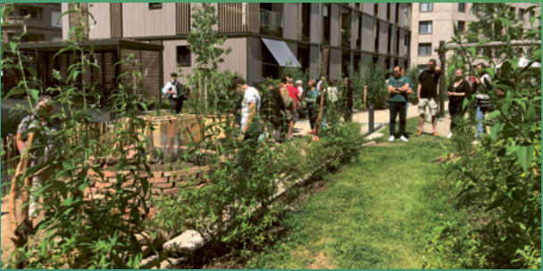
Eröffnungsfest im Gemeinschaftsgarten

So schnell kann eine Idee Gestalt annehmen: Inspiriert von den Naturgärten bei der BUGA23 reichten Bewohner*innen von OIKOS eG (Alice-Droller-Str. 5) im Oktober letzten Jahres einen Antrag auf Förderung eines Klimaprojektes ein. Anfang 2024 erhielten sie die Zusage und schon im Juni dieses Jahres wurde der neue Naturgarten gemeinsam mit der Nachbarschaft eingeweiht. Glückwunsch!