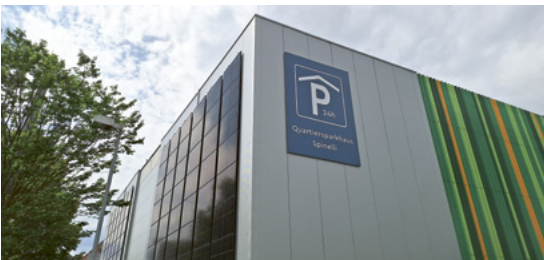
Das GBG-Parkhaus an der Talstraße

Für Besucher*innen des gesamten SPINELLI-Areals bietet das Parkhaus an der Ecke Wingertsbuckel/Talstraße eine weitere Möglichkeit, das Auto abzustellen. Das während der Bundesgartenschau nur für Mitarbeitende und Aussteller*innen reservierte Parkhaus steht nun allen offen. Kurzzeit- wie Dauerparkplätze lassen sich per bargeldlosem Zahlungsverkehr buchen. Es gibt keine Schranke oder Tickets. Das moderne Parkhaus verfügt über vier Geschosse mit insgesamt 347 Stellplätzen, von denen rund 80 mit Elektro-Ladepunkt ausgestattet werden. Wenn das Quartier der GBG fertiggestellt ist, wird das Parkhaus analog zur bewährten Quartiersgarage SPINELLI Nord zur neuen SPINELLI Quartiersgarage Süd.